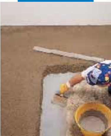
Stesura della boiaccia di ancoraggio per massetti aderenti in Topcem