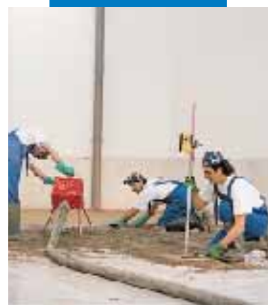
Fase di stesura dell'impasto di Topcem