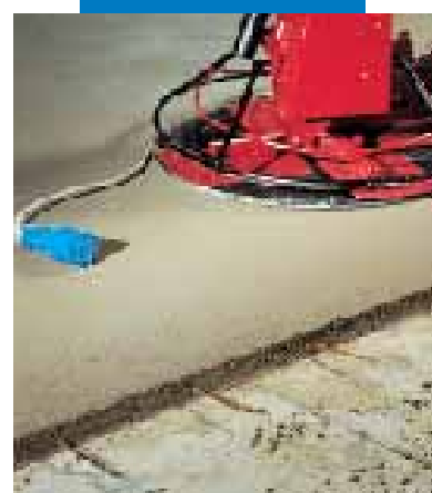
Finitura superficiale con elicottero