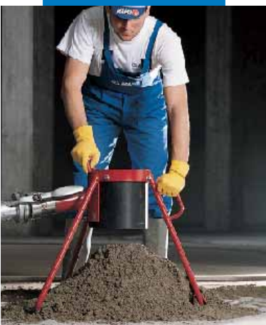
Alimentazione di impasto di Topcem