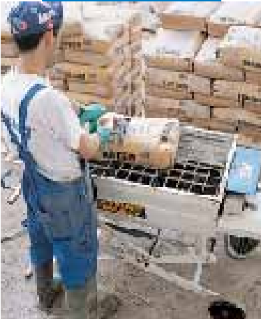
Impasto di Topcem con miscelatore a coclea