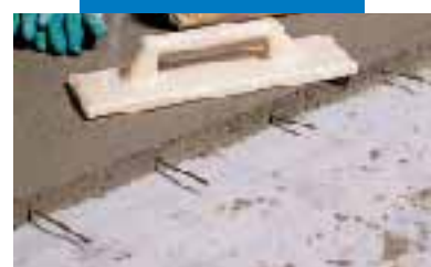
Particolare di massetto in Topcem con ferri di ripresa di getto