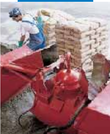
Impasto di Topcem con impianto automatico di pompaggio